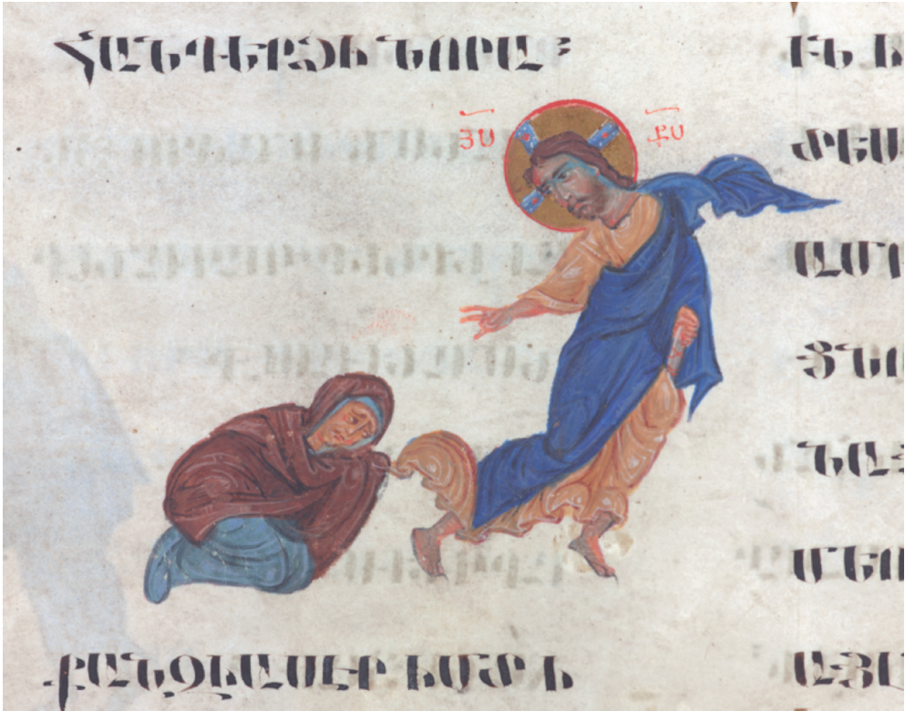
Christus en de bloedvloeiende vrouw , Armeens evangelium, ca. 1250. Philadelphia, Freer Gallery of Art, Ms 1932.18, fol. 50.

genezen wordt door de zoom van het kleed van Christus aan te raken. De impactgeschiedenis van het motief bracht ons voorbij de bekende grenzen van het iconografische motief. We exploreerden verder en we daalden dieper af, tot in de krochten van wat de mensheid fascineert én beangstigt. Zo verwierf ons onderzoek kennis over de aanvoelingspatronen omtrent de fenomenologie van bloed, het aanrakingstaboe en textiel als magische aftap van krachten, een zeer diep archetype in vele culturen.