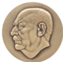
Emile Francqui (1863-1935).

Hoe het ook zij: wellicht is het precies de scharnierpositie van België in drie taalzones die de huidige rijkdom van kunstwetenschappen in de Lage Landen verklaart: voortdurend onder invloed, voortdurend vriendelijk 'besmet' en voortdurend alert voor nieuw initiatief.