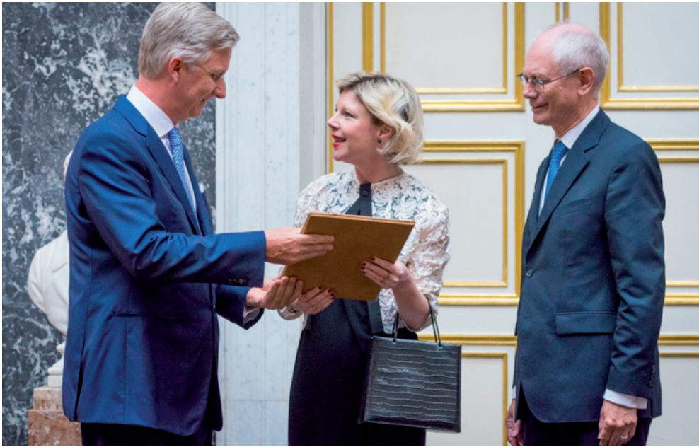
Overhandiging Francquiprijs. 8 juni 2016, Paleis der Academiën, Brussel.

Francqui-Prijs Humane Wetenschappen 2016 heeft mogen ontvangen, is een uitzonderlijke erkenning van de prominente plaats die haar werk inneemt in de recentste ontwikkeling van de iconologie. Uiteraard straalt deze prijs af op de kunstwetenschappen in ons land, als discipline die door studie de zorg om ons werelderfgoed behartigt. Maar het is vooral een erkenning van het maatschappelijke belang van het onderzoek naar de betekenis van beelden, die onze perceptie van de werkelijkheid in toenemende mate beïnvloedt.