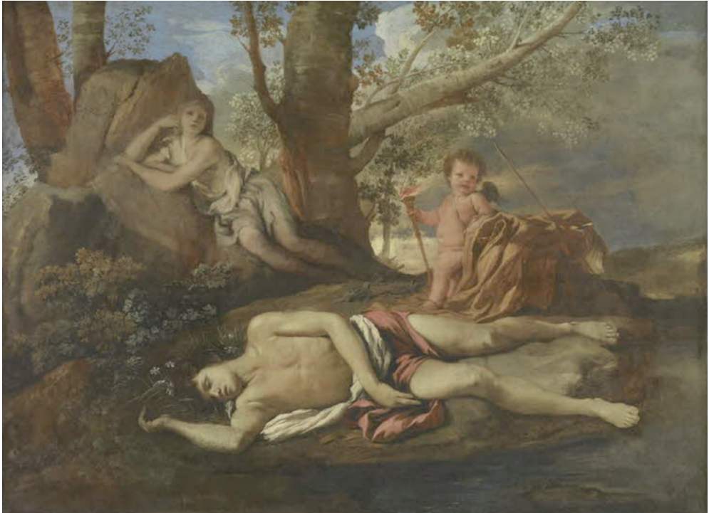
Echo en Narcissus , Nicolas Poussin (1594-1665), 1628. Parijs, Musée de Louvre.

singulière qui anime les sciences de l'art dans leur ensemble, réside peut-être dans sa résistance à toute classification. Comme le fit aimablement remarquer le philosophe italien, et grand connaisseur de l'art, Giorgio Agamben: parmi les sciences l'histoire de l'art traite d'une science sans nom . Nul ne doute que la position charnière de la Belgique, avec ses trois régions linguistiques s'entrechevauchant, ne soit pour quelque chose dans la moisson particulièrement riche des sciences de l'art: ouverte à toutes les dynamiques, à toutes les inséminations et contagions à bon escient, et toujours à l'écoute.