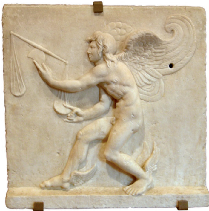
Kairos, de Griekse god van het tijdsmoment en de wind, Romeins bas-relief naar het origineel van Lysippos, ca. 350 v.Chr., Archeologisch Museum van Turijn.

Adonis a raison. Bien des choses demeurent cachées dans un livre, ou ne se montrent que par intermittences.