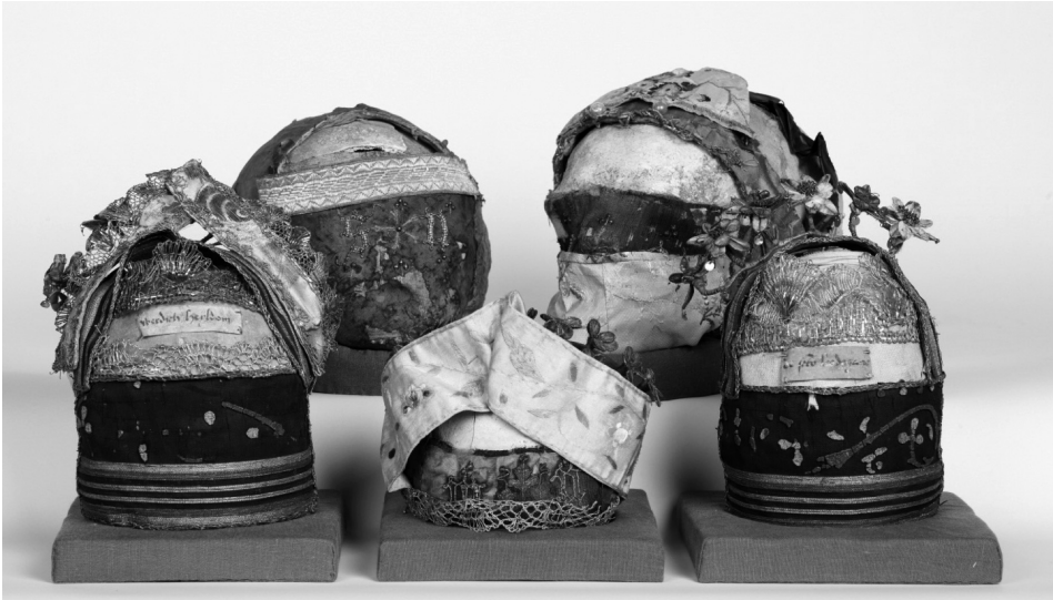
Afb. 3 – Hasselt, Kathedraal Sint-Kwintinus. Vijf relikschedels van de Cisterciënzerinnenabdij van Herkenrode, na behandeling © KIK-IRPA, Brussel.

zoeksresultaten van materiaal-technische aard bieden het kunsthistorisch en historisch onderzoek interessante data die moeten ingepast worden in het stijlkritisch en het bronnenonderzoek. Dankzij een dergelijk grootschalig onderzoek kon ook een rangorde van de kwaliteitsvolle beelden die dringend behandeling nodig hebben, worden opgesteld. Maar het KIK beperkt zijn onderzoek niet enkel tot roerend erfgoed. Ook architecten, bouwhistorici en monumentzorgers wenden zich met hun vragen tot de instelling. Zij laten niet alleen materialen en technieken analyseren maar vragen ook onderzoek naar duurzame producten en technieken die de conservering en de stabiliteit van monumenten of sites op lange termijn kunnen verzekeren.