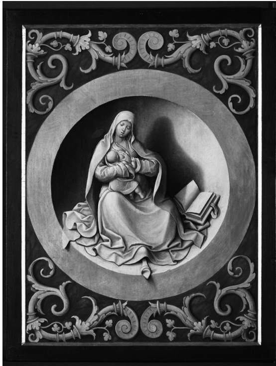
Afb. 1 – Antwerpen, Kerk Sint-Jacob, Reeks schilderijen met Legende van de H. Rochus , 1517, olie op paneel: Zogende O.-L.-Vrouw met Kind , voor behandeling