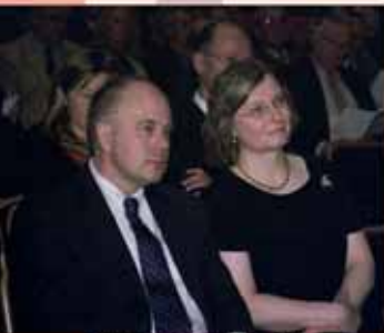
Gouden Penning 2005: Ingrid Daubechies

Om haar waardering uit te drukken voor bijzondere artistieke en wetenschappelijke verdiensten en ter bevordering van kunsten en wetenschappen reikt de KVAB een aantal prijzen uit.