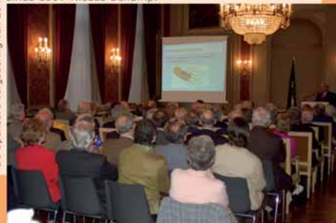
De Openbare Vergadering van 20 mei 2006 te Gent

Alle academies hebben het in de twintigste eeuw moeilijk gehad: waar ze in 1900 centraal stonden in het wetenschappelijk onderzoek met sponsoring, peer-review avant la lettre, publicatie van de resultaten etc, is hun impact hand over hand afgenomen als gevolg van het succes van de wetenschap, de toename van de middelen, de specialisering etc. In sommige landen is hun invloed nog bijzonder belangrijk (UK, Zweden, US, ook Nederland). In Vlaanderen is de Koninklijke Vlaamse Academie van België voor Wetenschappen en Kunsten aan een inhaalbeweging bezig: zij wordt opnieuw een belangrijk forum voor wetenschap en kunst, met ca. 100 symposia per jaar plus vele tientallen andere activiteiten. Zij herbergt eveneens het Vlaams sabbatcentrum VLAC, waar toponderzoekers en –kunstenaars uit de hele wereld worden uitgenodigd voor een verblijf van enkele maanden. Verder verzorgt zij de publicatie van