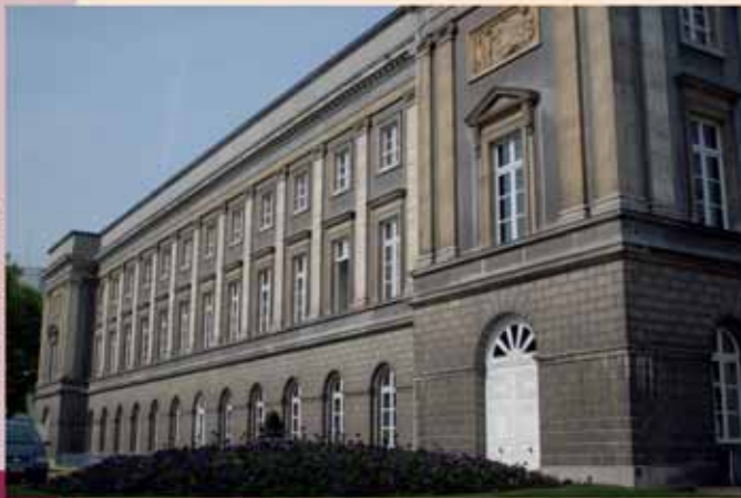
Het Paleis der Academiën

Alle academies hebben het in de twintigste eeuw moeilijk gehad: waar ze in 1900 centraal stonden in het wetenschappelijk onderzoek met sponsoring, peer-review avant la lettre, publicatie van de resultaten etc, is hun impact hand over hand afgenomen als gevolg van het succes van de wetenschap, de toename van de middelen, de specialisering etc. In sommige landen is hun invloed nog bijzonder belangrijk (UK, Zweden, US, ook Nederland). In Vlaanderen is de Koninklijke Vlaamse Academie van België voor Wetenschappen en Kunsten aan een inhaalbeweging bezig: zij wordt opnieuw een belangrijk forum voor wetenschap en kunst, met ca. 100 symposia per jaar plus vele tientallen andere activiteiten. Zij herbergt eveneens het Vlaams sabbatcentrum VLAC, waar toponderzoekers en –kunstenaars uit de hele wereld worden uitgenodigd voor een verblijf van enkele maanden. Verder verzorgt zij de publicatie van